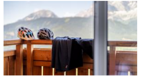
Radfahren und Mountainbiken