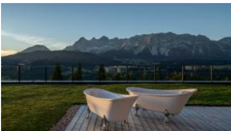
Die besten Ideen kommen bekanntlich in der Badewanne