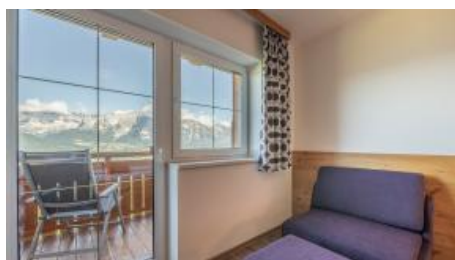
Sofa am Zimmer