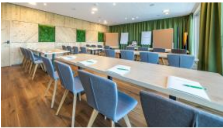
Parlamentarische Bestuhlung für 24 Personen