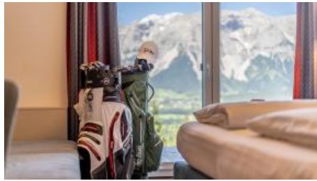
Golfen in Schladming-Dachstein