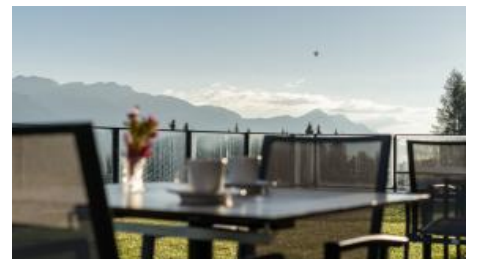
auf der Terrasse