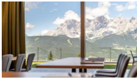
Seminarraum mit Panoramafenster