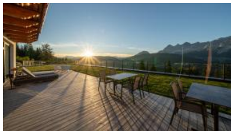
Terrasse mit Abendsonne