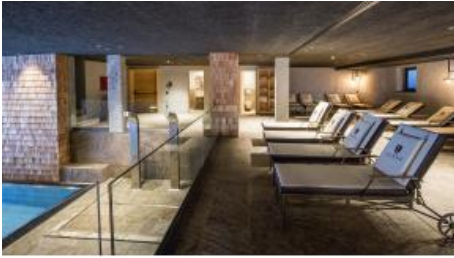
Tenne Pool & Relax